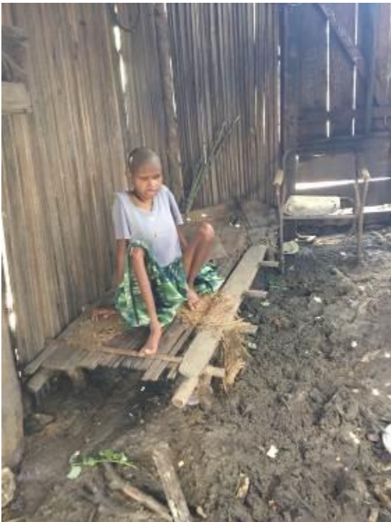
Er werd een huisje gebouwd voor deze gehandicapte vrouw op West-Timor

In de bestuursvergadering van 7 maart werd het beleids-activiteitenplan 2017-2018 bijgesteld. Daar waar nodig werd dit plan door onvoorziene gebeurtenissen en/of aan ons gerichte verzoeken tot ondersteuning van een project tussentijds aangepast.