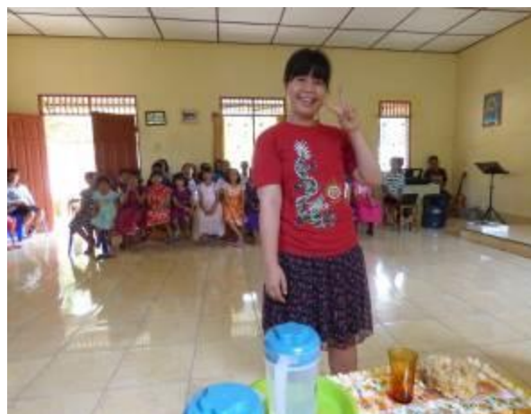
Een van de kinderen was geslaagd en gaat door naar de universiteit

Het weeshuis in Pematang Siantar waar 40 weeskinderen verblijven kon ook in 2018 rekenen op onze steun dankzij de statiegeldacties en enkele donaties. Deze steun stond m.n. uit bijdragen in studiekosten van enkele jongeren die een universitaire opleiding volgen.