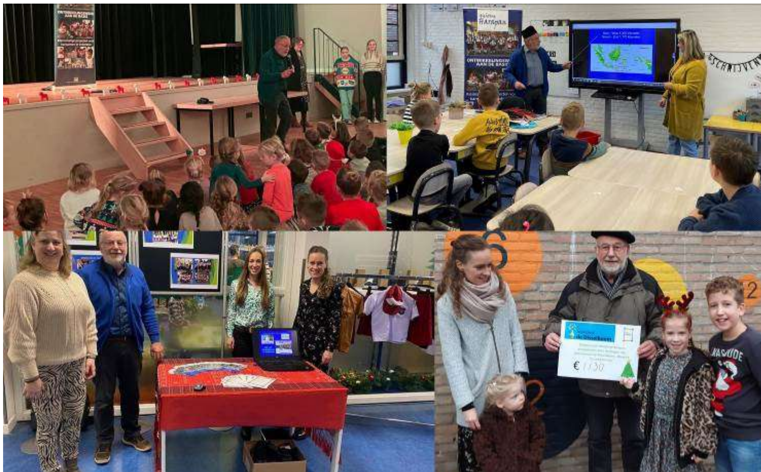
kerstmarkt in Wintelre op basisschool de Disselboom met vooraf in alle klassen voorlichting

- Op basisschool de Disselboom in Wintelre werd op mede-initiatief van de Werkgroep Ontwikkelingswerk Wintelre de Kerstmarkt georganiseerd voor het uniformenfonds met als thema : Wij naar school, zij naar school De markt was zeer geslaagd, niet alleen de opbrengst (€ 1.130,-) was geweldig, maar ook de belangstelling voor onze stichting.