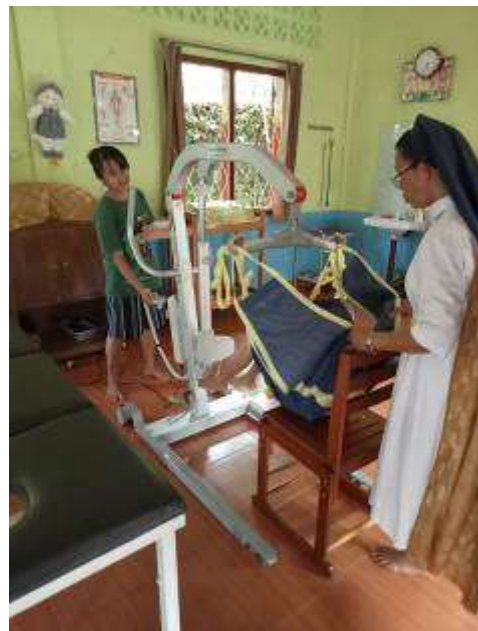
de nieuwe tillift