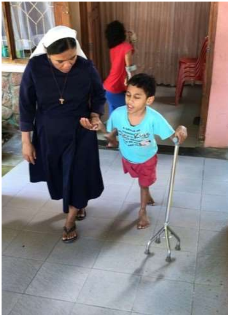
rehabilitatiecentrum Hidup Baru